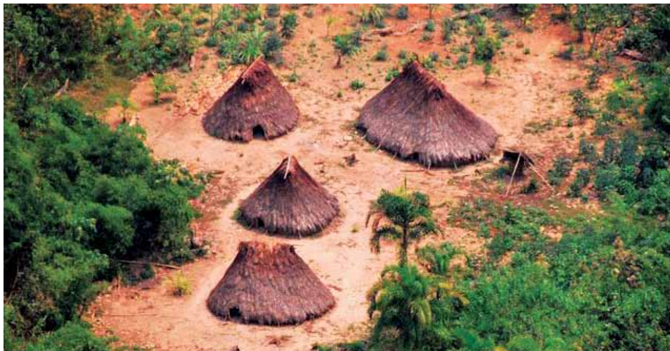
Pueblo Nahua

La Reserva Territorial Nahua, Kugapakori y Nanti (RTNKN) fue creada por el Estado peruano en 1990 (RM N° 046-90-AG/DGRAAR) para proteger a los pueblos indígenas aislados Kugapakori, Nahua, Nanti y otros.