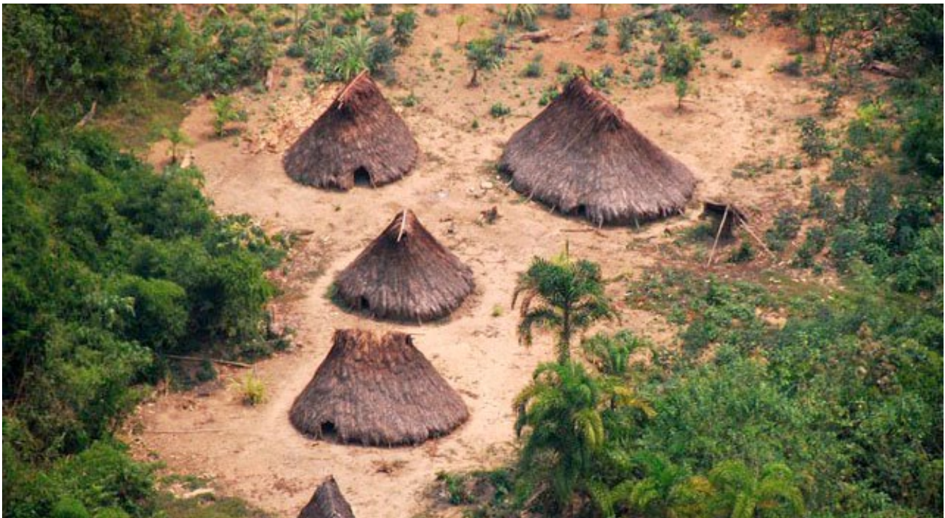
Pueblo Nahua

memoria descriptiva del proyecto, sino también sobre los términos de referencia y hasta sobre el propio Estudio de Impacto Ambiental.