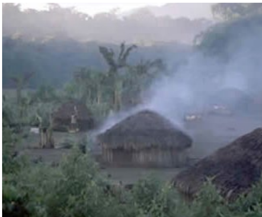
Pueblo Nahua

Como se sabe, los pueblos que habitan la Reserva Territorial Nahua Kugapakori y Nanti son particularmente vulnerables a enfermedades y debido a su situación de aislamiento y a su reducido número, un contacto forzado podría causar la desaparición física de sus miembros. Conscientes de ello y habida cuenta que en el mundo existe un reducido número de Pueblos Indígenas en Aislamiento Voluntario y Contacto Inicial, el Derecho Internacional 1 recomienda la protección absoluta de sus territorios para asegurar su supervivencia física y cultural.