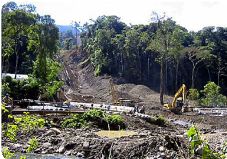
Obras de construcción del primer ducto del Proyecto Camisea

Desafortunadamente hubo otras presentaciones que hablaron más del trabajo del actual gobierno que de las acciones en Camisea, como la exposición del Ministerio de la Mujer y el Desarrollo