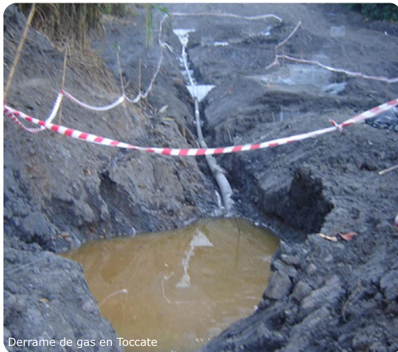
Derrame de gas en Toccate

Una de las exposiciones más interesantes, estuvo a cargo del Consultor Gustavo Guerra García, quien, por encargo del Gobierno Regional de Ayacucho, realizó un estudio para evaluar las inequidades en la distribución del Canon gasífero, así como la elaboración de una propuesta económica para presentar una petición de modificatoria de la Ley del Canon. En el siguiente cuadro se muestra la diferencia de recursos que reciben las provincias afectadas por el proyecto Camisea.