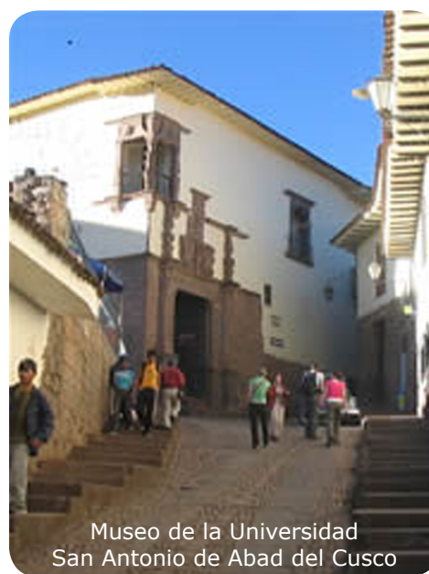
Museo de la Universidad San Antonio de Abad del Cusco

Así es, el canon es un derecho adquirido. Si los gobiernos regionales, locales o las universidades no gastan, ese dinero se mantiene en sus cuentas ganando intereses.