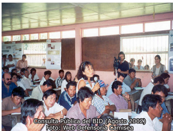
Consulta Pública del BID (Agosto 2002)

Sobre el gas natural, en la reunión de la sociedad civil con el Presidente Moreno se le señaló la preocupación nacional por la seguridad energética, tema que se encuentra en el debate público nacional y que ha provocado inclusive el pronunciamiento de algunos colegios profesionales del país rechazando el proyecto de exportación (Perú LNG). Asimismo, se le recalzó que este proyecto de exportación del gas de los Lotes 88 y 56, apoyado por el BID mediante un financiamiento de US$ 400 millones, se basó únicamente en un estudio de los beneficios que el proyecto podría generar más no en un análisis costo beneficio comparándolo por ejemplo con los costos de importar petróleo durante los años que dure el proyecto de exportación.